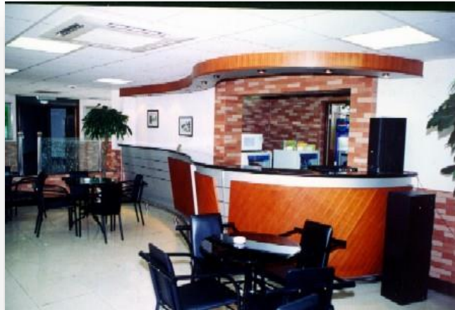
[ 매점 ]