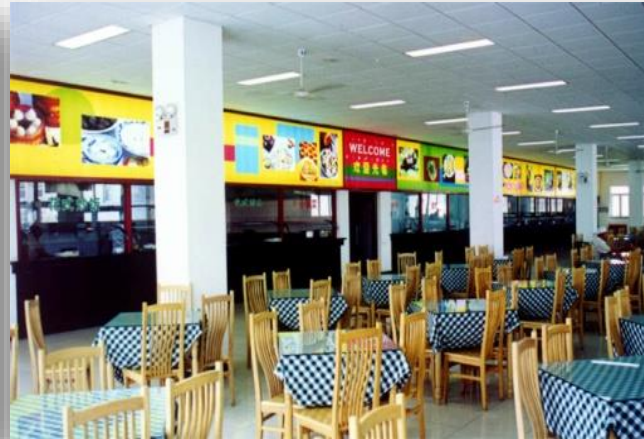
[ 식당 ]