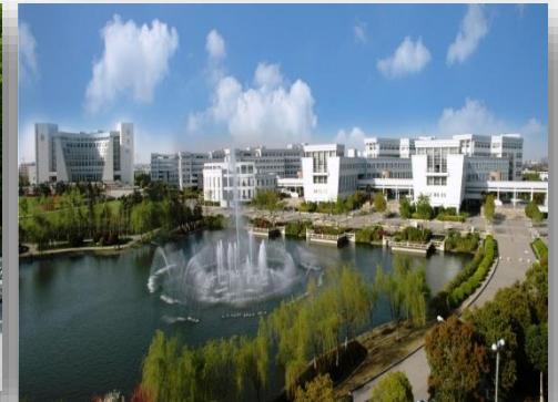
[ 캠퍼스 풍경 ]