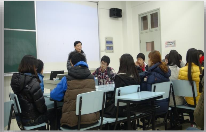
[ 강의실 ]