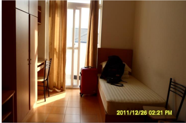
[ 숙소 1 ]