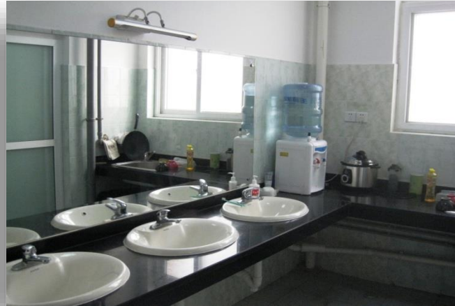
[ 숙소 2 ]