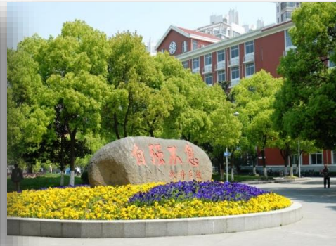
[ 교내 자연녹화 풍경 ]