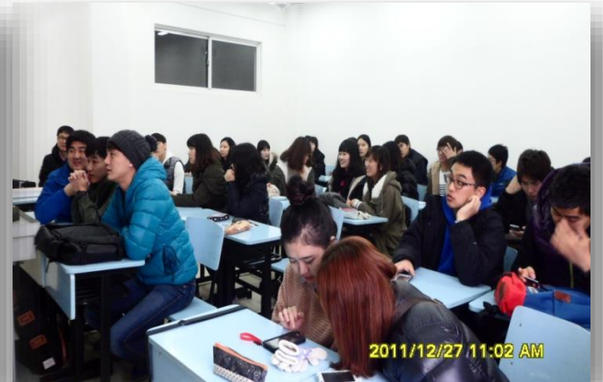
[ 강의실 ]