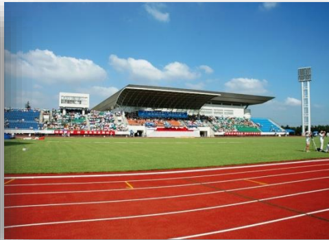
[ 학교 종합체육관 ]